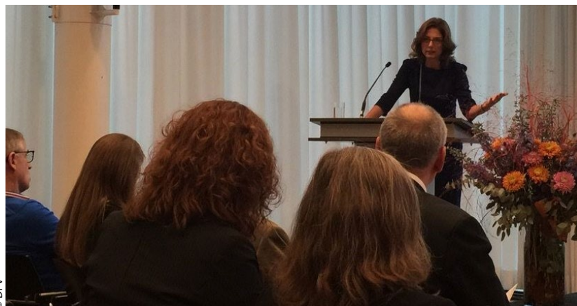
Sabine Bätzing-Lichtenthäler, Ministerin für Soziales, Arbeit, Gesundheit und Demografie des Landes Rheinland-Pfalz

Initiiert werden die Berliner Runden – die sich an Vertreter von Bund und Länder, Organisationen der Pflege und Selbsthilfe wie auch die interessierte Öffentlichkeit richten – von den Gesundheitsministerien in Rheinland-Pfalz und Nordrhein-Westfalen.