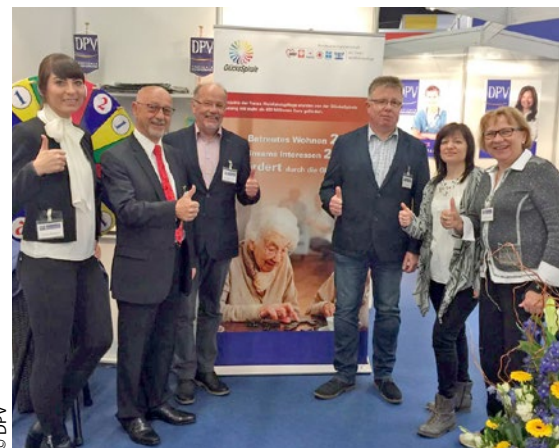
Das DPV-Team am Stand auf der ALTENPFLEGE 2017.

Der Deutsche Pflegeverband nahm auch in diesem Jahr erfolgreich an der Messe teil. Die hauptamtlichen Mitarbeiter und anwesenden Vorstandmitglieder haben zahlreiche Gespräche mit Interessierten geführt. Der DPV hat diese Gelegenheit wahrgenommen, um die Bevölkerung für pflegerische Themen zu sensibilisieren. Insbesondere die Schüler kamen mit viele Fragen von der Pflegeberufereform bis hin zu