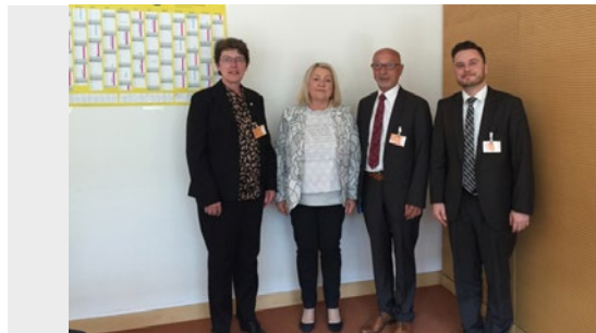
Birgit Wöllert (MdB; 2. von links) und die Vertreter von Safety First

Tipp: Gegen die entsprechende (rechtswidrige) Anordnung steht Ihnen das Recht der Remonstration zu. Teilen Sie dem anweisenden Arzt Ihre Bedenken schriftlich mit und fordern Sie ihn auf, eine Rechtsgrundlage für die Anordnung zu nennen. Arbeitsrechtlich drohen Ihnen für die Wahrnehmung des Remonstrationsrechts keine Konsequenzen.