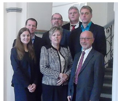
Die Referenten und Moderatoren der 45. Pflegefachtagung