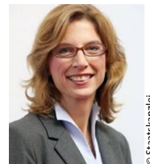
Ministerin Sabine Bätzing-Lichtenthäler