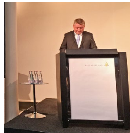
Bundesgesundheitsminister Gröhe bei der Eröffnung